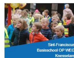
Sint-Franciscus Basisschool OP WEG Knesselare