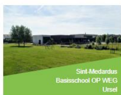
Sint-Medardus Basisschool OP WEG Ursel