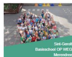
Sint-Gerolf Basisschool OP WEG Merendree