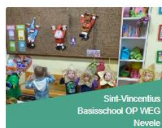
Sint-Vincentius Basisschool OP WEG Nevele