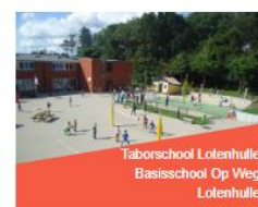
Taborschool Lotenhulle Basisschool Op Weg Lotenhulle