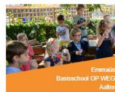
Emmaüs Basisschool OP WEG Aalter