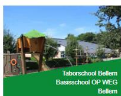
Taborschool Bellem Basisschool OP WEG Bellem