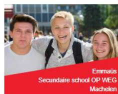
Emmaüs Secundaire school OP WEG Machelen