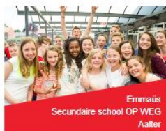
Emmaüs Secundaire school OP WEG Aalter