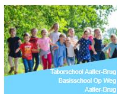
Taborschool Aalter-Brug Basisschool Op Weg Aalter-Brug