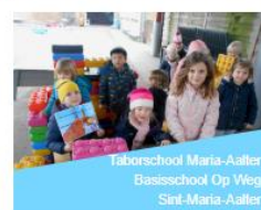
Taborschool Maria-Aalter Basisschool Op Weg Sint-Maria-Aalter