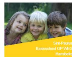
Sint-Paulus Basisschool OP WEG Hansbeke